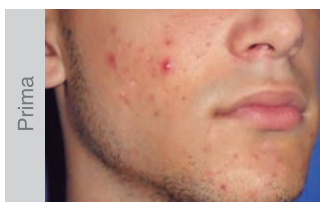
Foto scattate prima e dopo 3 sedute di trattamento combinato.