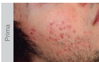
Foto scattate prima e dopo 1 seduta di trattamento combinato.